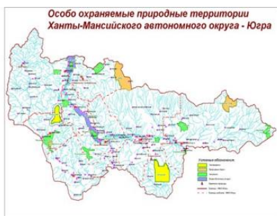
Рис. 1. Особо охраняемые природные территории Ханты-Мансийского автономного округа – Югры